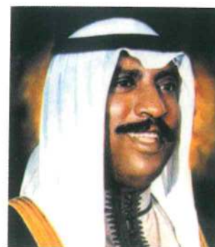
H.H. SHEIKH SAAD AL-ABDULLAH AL-SALEM AL-SABAH