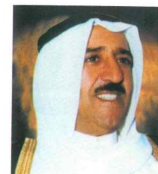
H.H. SHEIKH SABAH AL-AHMAD AL-JABER AL-SABAH