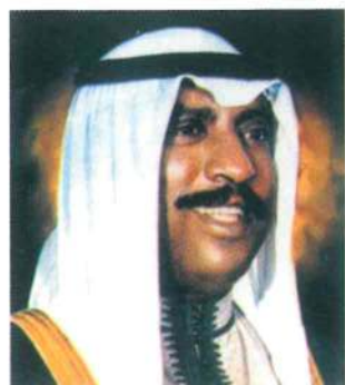
سمو الشيخ سعد العبد الله السالم الصباح