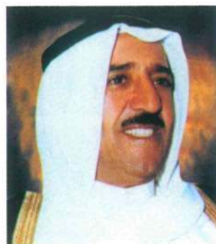
سمو الشيخ صباح الأحمد الجابر الصباح