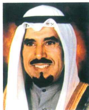
حضرة صاحب سمو الشيخ / جابر الأحمد الجابر الصباح