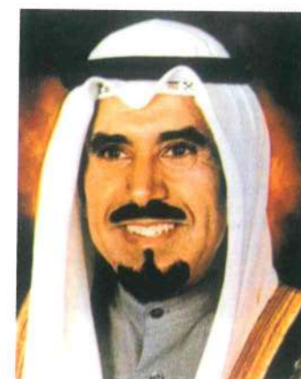
H.H. SHEIKH JABER AL-AHMAD AL-JABER AL-SABAH